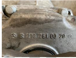
Bak nr. R210 261 00 20