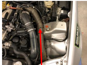
Lucht Inlaat slang koppeling cilinder