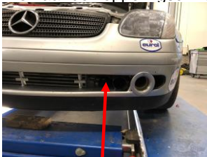
Luchtinlaat voor Koppeling cil.

Om de koppeling cilinder extra te koelen mag men een extra inlaat luchtslang monteren. Die naar de koppelingcilinder leidt.