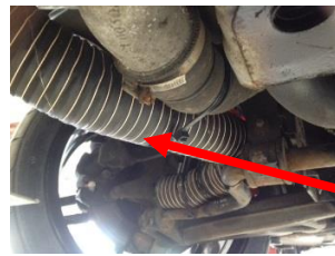
Koel slang remmen